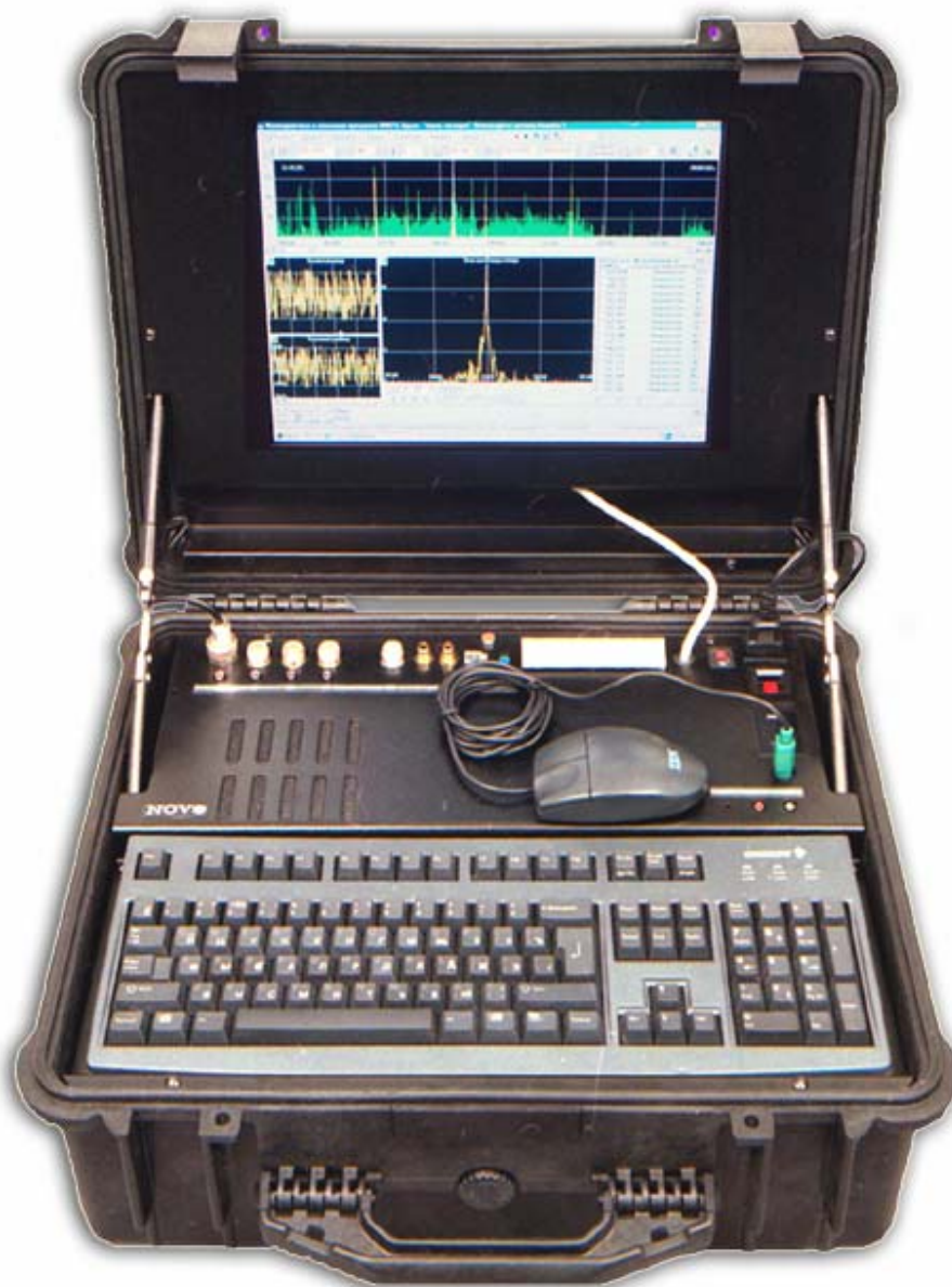
Внешний вид комплекса «Омега»